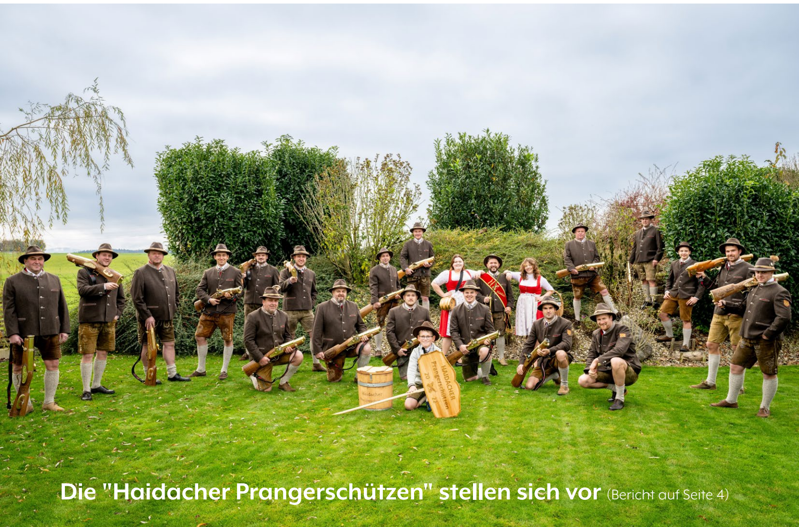
Die "Haidacher Prangerschützen" stellen sich vor (Bericht auf Seite 4)

Bürgerinformation der Marktgemeinde Straßwalchen Nr. 08/ August 2025