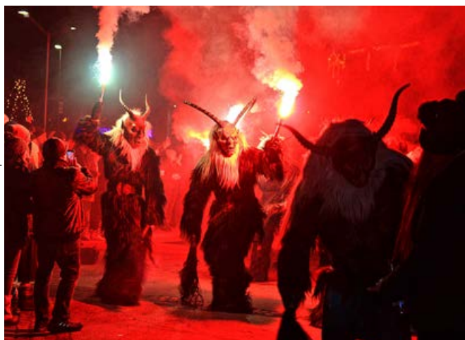
Bilder: Straßwalchner Krampusse

Kommt vorbei und feiert mit uns 30 Jahre Brauchtum & Leidenschaft!